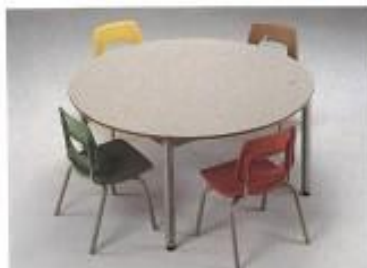
Mesa código: 40D100