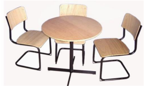
Mesa código: 41D120-75R