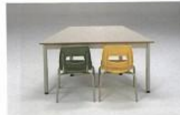
Mesa código: 40T120-70