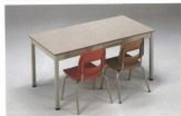
Mesa código: 40R12060-60